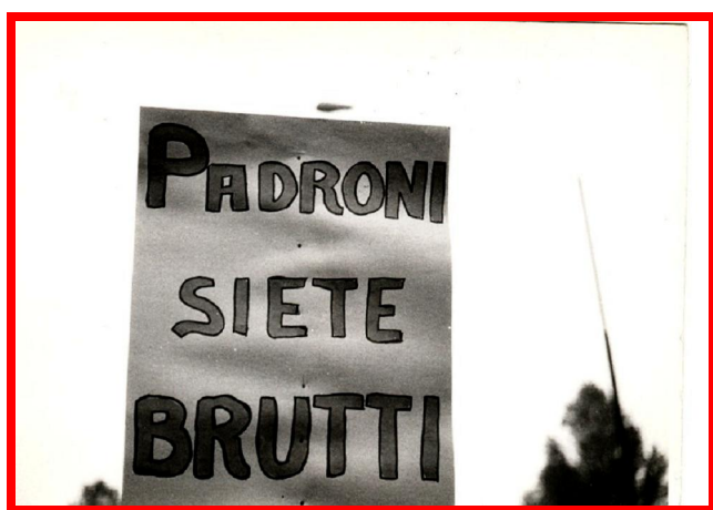
Manifestazione sindacale a Torino, 1969

[...] | L' FLM per noi, per me é stata veramente lezione di apprendimento, di conoscenza che poi portavi dentro nelle fabbriche, nel sindacato, quindi diventavano motivi di dibattito. Tante volte, spesso, anche di scontro politico.