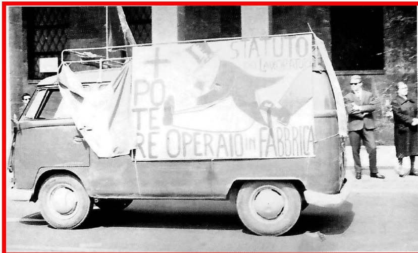
Bergamo, Primo maggio 1971

piuttosto sul piano di una affermazione dura e precisa dei diritti dei lavoratori che, come cittadini, partecipano alla costruzione di una repubblica fondata sul lavoro” 2