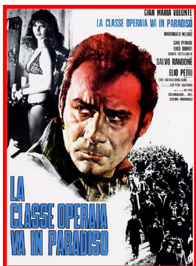
la locandina del film "La classe operaia va in paradiso" (1971)